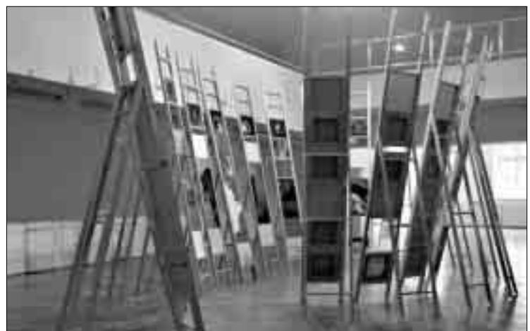
ESCALES. L'artista combina pintura i instal·lació a la recerca d'una unitat de sentit que va més enllà dels gèneres.